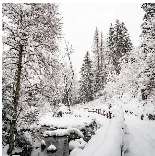
Comme un signal, la neige est au rendez-vous cette année