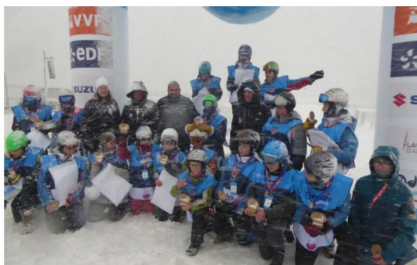
Les jeunes mushers de la Vallée à la Chapelle

Depuis plusieurs années, la position des résidents secondaires change en station. Ils se considèrent de moins en moins comme des touristes et de plus en plus comme des habitants à temps partiel et s'intéressent à la gestion de leur village de cœur. Leur apport économique est majeur, la part du potentiel touristique par le nombre de lits concernés justifie cette reconnaissance et un partenariat plutôt que le matraquage fiscal. (c'est quand même 100 jours/an d'occupation par logement en moyenne, soit plusieurs centaines de nuitées à la Chapelle ) Les résidents viennent même si la neige n'est pas là, et même quand la station est fermée.