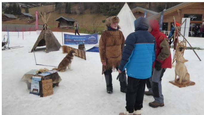
Le village de la grande Odyssee sur le site de la Panthiaz