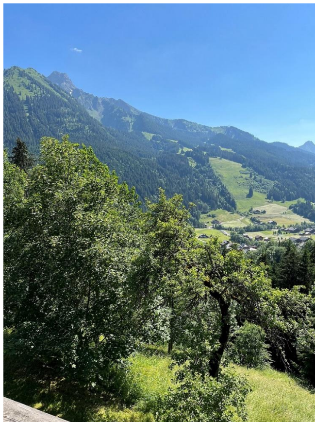
Après le blanc de l'hiver, la montagne décline la palette des verts

Renvoyez votre chèque de 15€ à : Alain Hastrate, 93 chemin des Gentianes, Apt 9 74360 La Chapelle d'Abondance