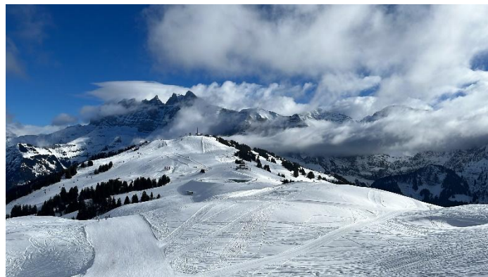
Magie de la Vallée d'Abondance couverte de son manteau blanc

Des maires de stations ont écrit à Bruno Lemaire, inquiets de voir que les différentes mesures à l'étude touchant la fiscalité des meublés et la performance énergétique risquent de déstabiliser ce volet de l'accueil touristique regroupant 80% des capacités d'accueil des stations.