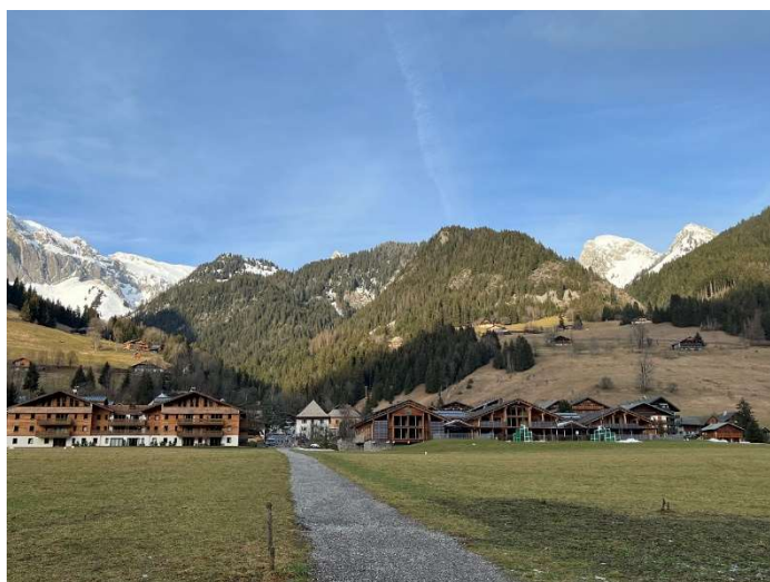
Paysage de fin décembre à 1000m d'altitude. Faudra-t-il s'y habituer ?

Toutes les bonnes volontés visant notamment à améliorer la parité seront les bienvenues.