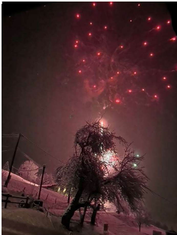
Feu d'artifice sous la neige sur les hauteurs de la Chapelle le «31 décembre

Je vous laisse imaginer comment vivent les communes de la même taille qui ne sont pas station de tourisme.....Connaissez-vous une commune en zone non tendue de – de 1000hts qui a quatre médecins, une pharmacie, dont le maire a une voiture de fonction, 6 agents à la mairie (et je passe sur les moyens des services techniques) et qui a le budget d'une commune de 4000 hts, même si ces communes n'ont pas à subir le déficit chronique des remontées mécaniques ?