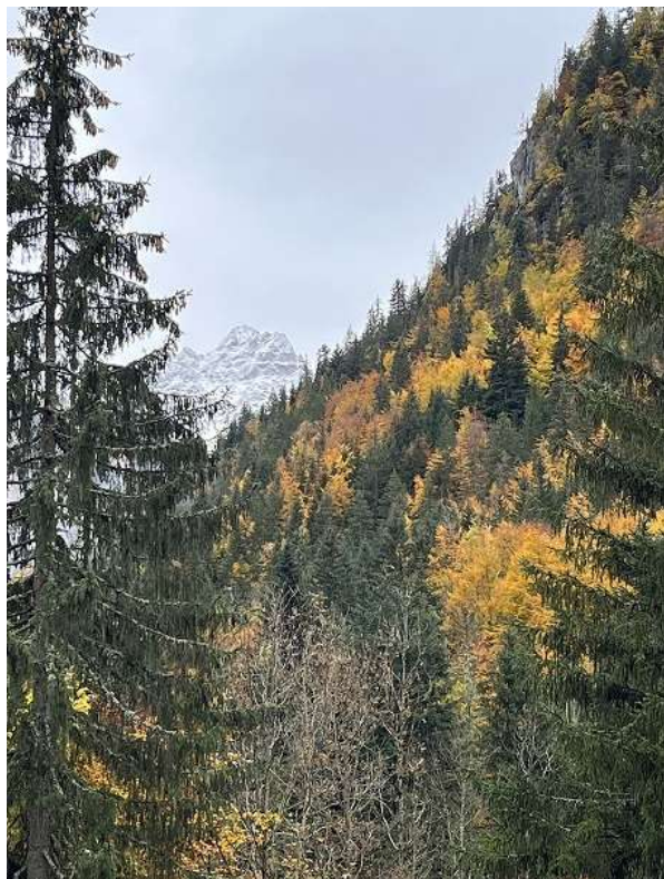
Couleurs d'automne à la Chapelle

Dans son rapport la CRC constate que la commune est dans l'impossibilité d'équilibrer le budget des remontées mécaniques depuis 35 ans. Face aux perspectives climatiques peu engageantes pour l'avenir : manque de neige, désintérêt des potentiels délégataires et coût d'exploitation notamment lié aux futures grandes inspections, la CRC suggère de séparer la gestion des deux domaines et d'en fermer au moins un, voire les deux.