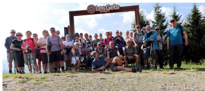
Les résidents des 4 stations au départ de la randonnée

Cette année ce sont nos amis des Gets qui nous ont reçus d'une façon exceptionnelle, pour cette réunion annuelle. Malgré un temps orageux, la journée s'organisait entre une randonnée/visite d'une poterie ou la visite du musée des orgues mécaniques et d'une course aux trésors.