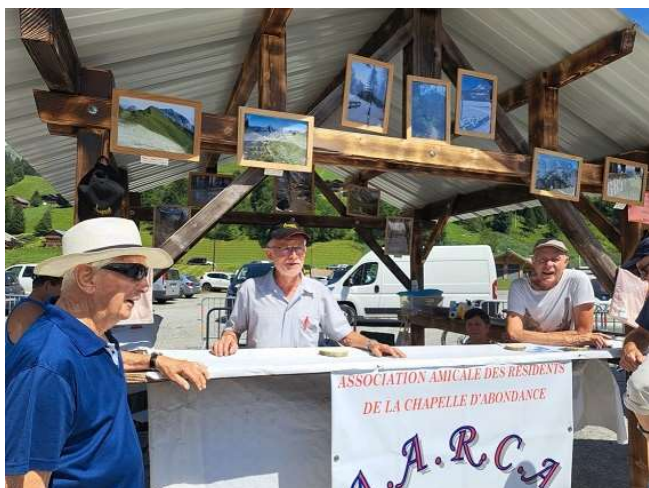
Le stand de l'AARCA à la fête des bûcherons visité par nos fidèles adhérents

Nous étions présents à la Fête des Bûcherons le 13 août pour faire connaître notre association et surtout vous rencontrer.